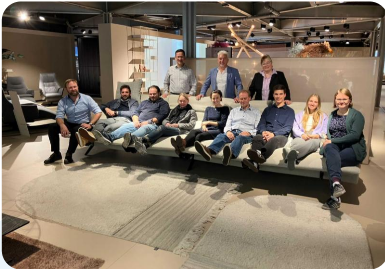
Gruppenbild des Vorgängernetzwerks: ReNet – ReportingNetzwerk