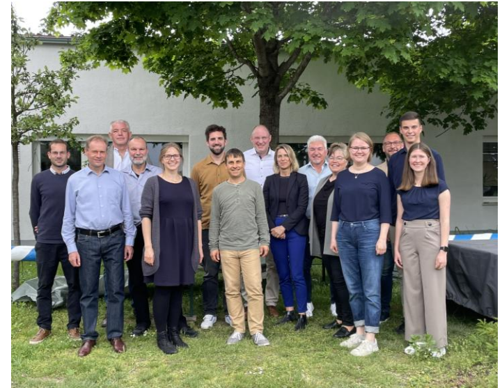
GRUPPENBILD BEIM KICK-OFF DES NETZWERKS